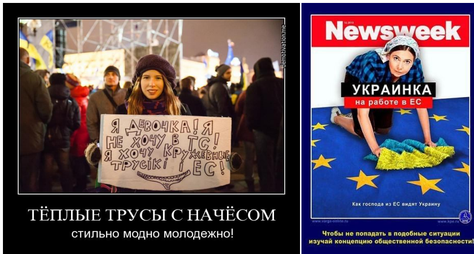
Рис. 4. ВОЖДЕЛЕНИЯ И ПЕРСПЕКТИВЫ В ИХ НАИЛУЧШЕМ ВИДЕ

Изложенное выше в разделе 2.2 — иллюстрация на тему, что течение истории алгоритмично 1 , и носителем алгоритмики, реализовавшейся в конкретном течении свершившихся событий, является коллективная психика общества, с которой взаимодействует психика каждого индивида, частью этого общества являющегося.