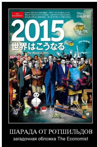
Рис. 1. «ПРОЦЕСС ПОШЁЛ» — ВОПРОС ТОЛЬКО: КУДА?

По отношению к политике люди делятся на три категории: 1) политически безучастные, участь которых — быть жертвами политики, 2) заинтересованные наблюдатели и оценщики-комментаторы, дополняющие политически безучастных в списках жертв политики, 3) практикующие политики (и это не только государственные деятели, чьи слово и подпись придают властную силу тем или иным документам, но и те, кто добивается намеченных политических результатов иными средствами). Редакция журнала «The Economist» подкинула заня-