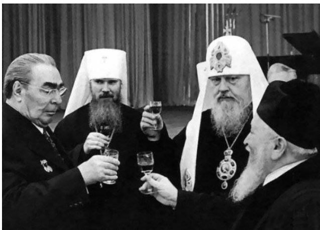
Иерархи идеологической власти библейского проекта в СССР в полном составе на приёме в Кремле в честь 60-летия Великой октябрьской социалистической революции.

Но если соотноситься со схемой управления толпо-«элитарным» обществом « концептуальная власть — идеологическая власть — государственность — общество », то в 1917 г. смены концептуальной власти не было. Концептуальная власть осталась прежней — властью хозяев библейского проекта глобализации, однако при этом идеология идеалистического атеизма была