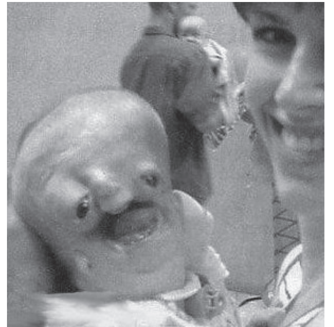
Дети... И мать одного из таких уродов беззастенчиво делает "cheese" на камеру после того, как зачала, выносила и родила такое...

Образы Кабанихи и ущербно воспитанного ею "любимого" её собственного сына из пьесы А.Н.Островского "Гроза" не высосаны им из пальца, как и мачеха Золушки с её дочерьми или