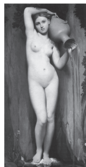
Ж.О.Энгр. Источник. 1856 г. Музей Орсе. Париж.

Соответственно, если рассматривать общество на интервалах времени, охватывающих жизнь нескольких поколений, то за женщиной - большей частью решение социально-стратегических задач в русле концепции, под властью которой живёт общество, хотя женщина может и не осознавать этого, либо не соответствовать своему биологическому и социальному предназначению; а за мужчиной - большей частью решение тактических задач в русле концептуально обусловленной стратегии, хотя и он может не осознавать этого и не соответствовать своему биологическому и социальному предназначению. И решение задач обоих классов протекает в русле эгрегоральной алгоритмики соответствующей национально-конфессионально обусловленной культуры. Поэтому: