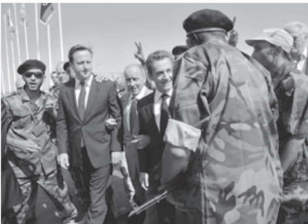
Дэвид Кэмерон и Николя Саркози не скрывали искренней радости в ходе сентябрьского визита на благодатную ливийскую землю.

Эта обнадеживающая для международных нефтегазовых компаний информация послужила причиной снятия с Ливии