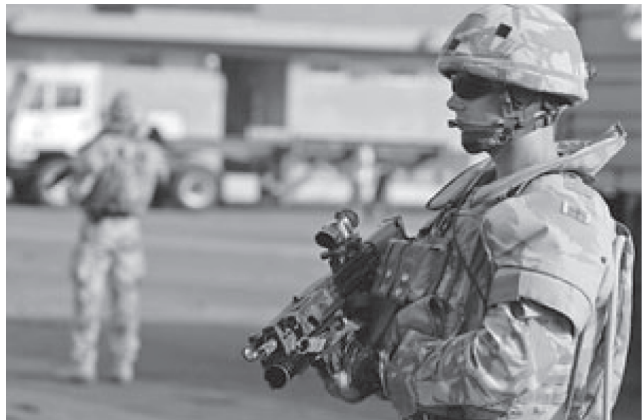
Британские солдаты на защите нефтяных интересов ТНК-транснациональных корпораций.

Нефтяные войны "элиты" Туманного Альбиона: неизвестные страницы английской экспансии