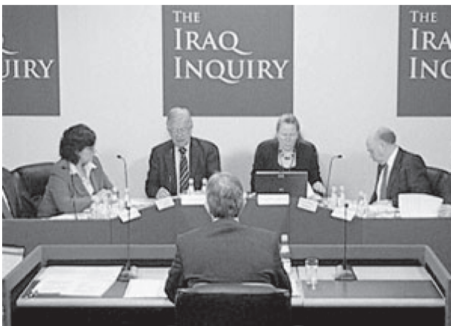
Тони Блэр тщетно пытался оправдаться в 2010 году перед независимой Комиссией по расследованию обстоятельств войны в Ираке.

К середине XX века Суэцкий канал приобрел колоссальное значение в связи с поставками нефти из стран Персидского залива в Западную Европу. Две трети провозимых через Суэцкий канал товаров составляла нефть, и две трети