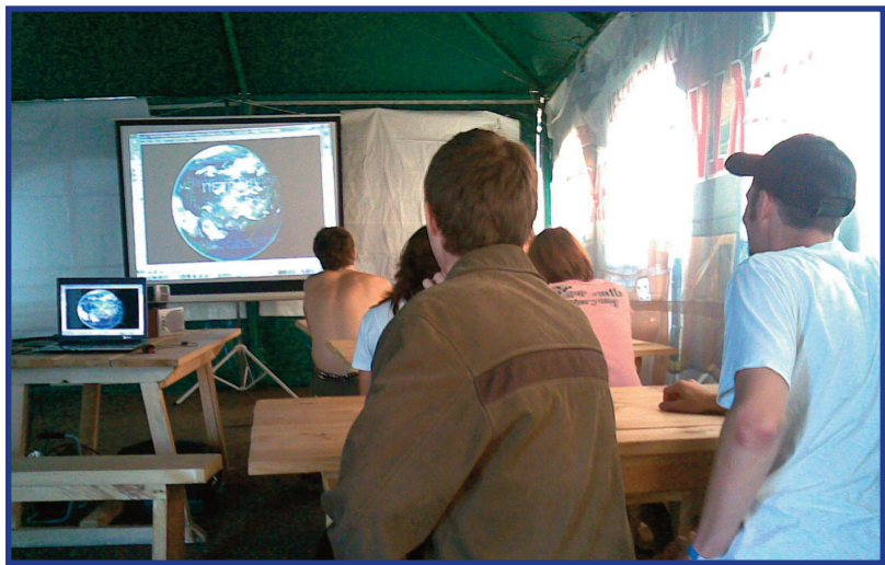
Просмотр видеоматериалов по Концепции общественной безопасности. На фестивале памяти Виктора Цоя.