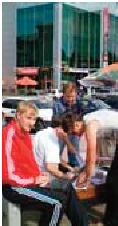
прохожие заполняют заявление о вступлении в ряды КПЕ

контактная информация в часы приема стационарный телефон ТЕЛ. 49 - 09 - 54, ICQ: 440-577-694.